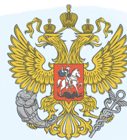
Министерство экономического развития РФ