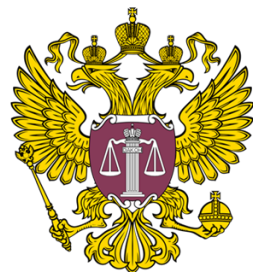
Верховный суд РФ